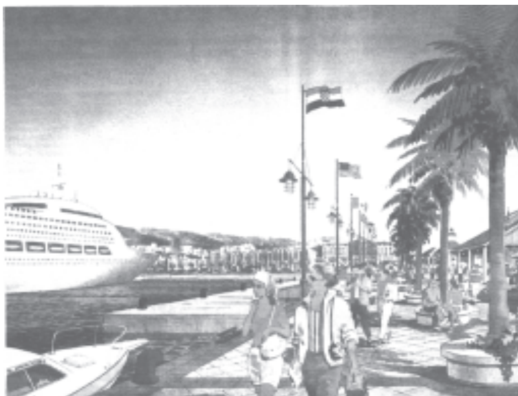
Split redizajniran prema projektu AFKO

Gdje su UNESCO-ove komisije, što je s civilnim društvom, kulturnim udrugama poput Prijatelja kulturne baštine? Njih se ignorira, uostalom kao i u Trogiru društvo »Radovan«. Na djelu je podzemna politika u koju su upregnuti pojedini arhitekti koji se ponašaju kao puki pragmatični zanatlije zajedno s političarima bez političkog i nacionalnog identiteta, ukratko, kolonizirani i potplaćeni.