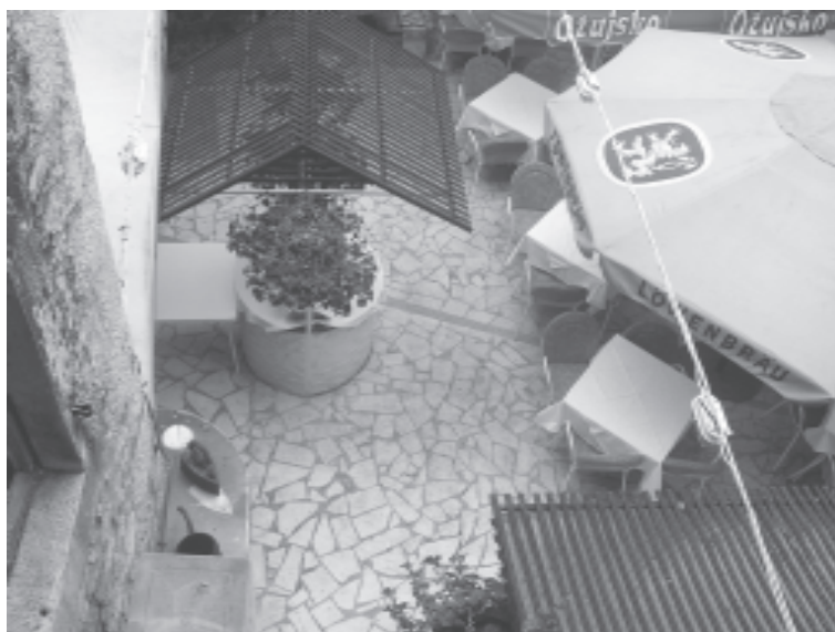
Jedan od posljednjih trogirskih perivoja, uništen i preinačen u restoran

U zaštiti povijesne jezgre Splita još se nastavlja praksa purifikacije pa tako i nakon upisa Splita u UNESCO-ov registar. Nakon registracije u međuvremenu je uništen cijeli niz kuća i jedna ulica u jugozapadnom kvadrantu palače. Nije se još proširila svijest kako je najveća vrijednost Splita upravo činjenica da je riječ o gradu koji se ugnijezdio unutar ruševina kasnoantičke carske Palače. Do početka 20. stoljeća o Trogiru i Splitu i njihovoj zaštiti brinuli su se eminentni stručnjaci svjetske reputacije zahvaljujući ponajprije Centralnom povjerenstvu za zaštitu spomenika iz Beča. O povijesnim jezgrama Splita i Trogira već se desetljećima odlučuje u uskim krugovima bez nacionalnih, a kamoli internacionalnih rasprava o pojedinim