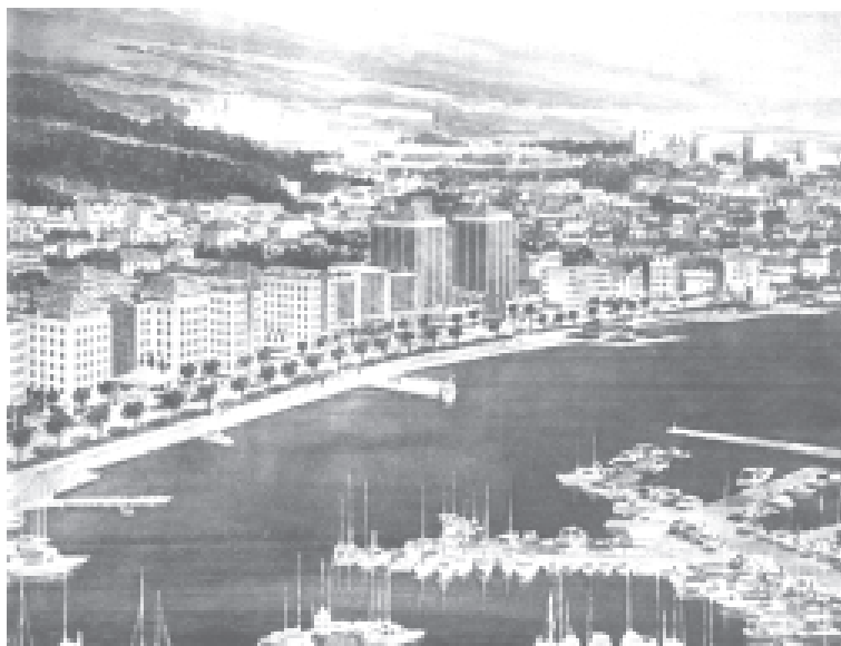
Istočna strana splitske luke prema projektu AFCO

Uzelca. Javno ga prozivam neka kulturnu javnost obavijesti što se to sprema s povijesnom jezgrom Trogira. Je li sastavio i pozvao međunarodne UNESCO-ove komisije, kad se već prihvaćaju (nečasne) ponude stranih investitora, bilo bi nužno konzultirati i međunarodne stručnjake, uključujući i one talijanske pa neka nam odgovore smiju li se takve stvari raditi u njihovim zemljama. Očekujemo odgovor.