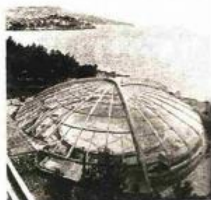
Hotel Zora u Primoštenu, sagrađen 1967. godine