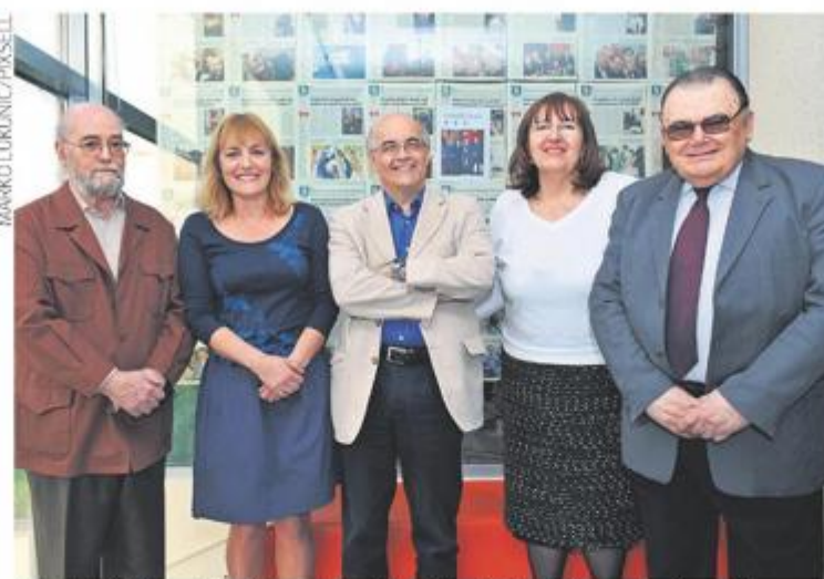
Academik Novak bio je i predsjednik žirija Večernjakove kratke priče

Slobodan Novak, rođen u Splitu 3. studenog 1924. godine, nije bio autor kvantitativno velikog opusa. Kao što je to lucidno rekao akademik Krešimir Nemeć, Novak nije pisao sabrana, nego izabrana djela. Ali bio je majstor proze u europskim i svjetskim razmjerima i pisac koji je bitno utjecao na generacije hrvatskih i ne samo hrvatskih književnika. Prvu knjigu, zbirku poezije "Gla-