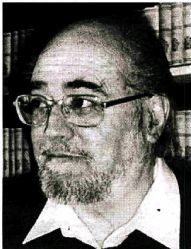
Slobodan Novak - autor jedne od kulturnih knjiga hrvatske književnosti, romana "Mirisi, zlato i tamjan"

Pjesma je ilustracija rečenog, ironije i određene nemirnosti, znakovitosti u traženju vrijednosti vjere i nevjere kroz svijet sumnje u kojem