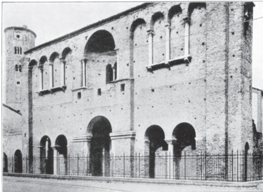
Slika 101. Tako zvana Teodorikova palača u Raveni (VIII. v.)

Iz svega se ovoga vidi, da su ostaci Dioklecijanove palače, uključivši amo i podzemne dijelove, bili od mletačke vlade smatrani javnim dobrom.